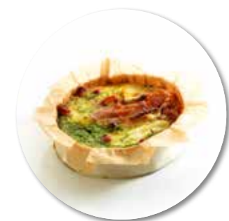
Quiche Zalm Ricotta ± 140 g per st. / 10 Ø / 8 st. Ref. 0210 * -18°