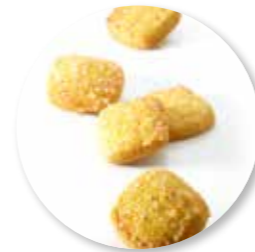
Pavé Sucré 800 g / ± 100 st. Ref. 1055