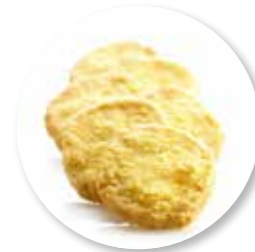
Pain Turc 800 g / ± 115 st. Ref. 0647