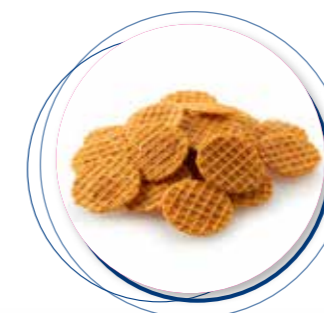
Mini Gaufrettes Tomaat Basilicum 450 g / ± 360 st. Ref. 2250