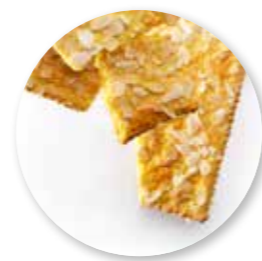
Brekkoeck Amandel ± 1000 g / 5 st. Ref. 1062

Deze producten zijn verkrijgbaar in een zwarte box .