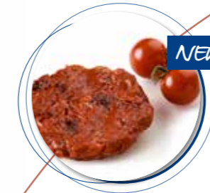
Tarte Tatin Kerstomaten ± 120 g per st. / 10 Ø / 8 st. Ref. 18041 * -18°