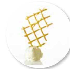
Soezenraster 6 st. Ref. 1615