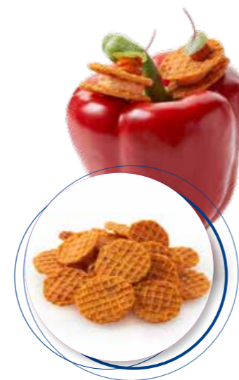
Mini Gaufrettes Chorizo Mozzarella 450 g / ± 440 st. Ref. 2251