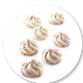
Meringue Mokka Hazelnoot 250 g / Ref. 10241