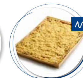
Amandel-Fruitcake Appel Crumble 385 x 280 x 32 mm / 2300 g Ref. 0405 * -18°