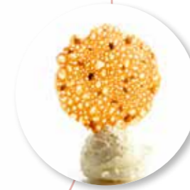
Kletsoppen Dessert 500 g / ± 140 st. Ref. 14021