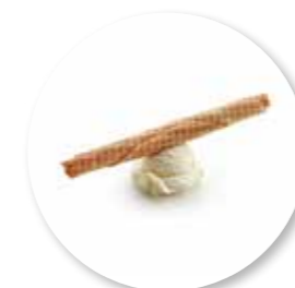
Retro Vanille Roulette 430 g / ± 28 st. Ref. 1082