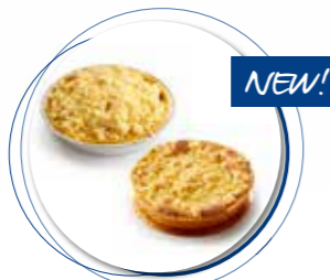
Bordalou Appel Crumble ± 110 g per st. / 8 Ø / 10 st. Ref. 05351 * -18°