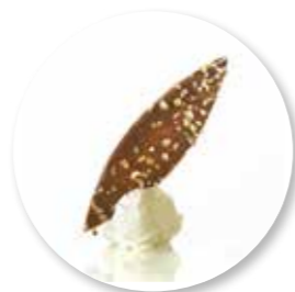
Pétale Chocolate Noisette 80 st. Ref. 1618