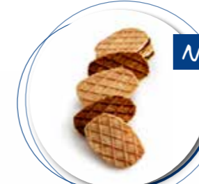
Retro Lukken 800 g / ± 78 st. Ref. 1022