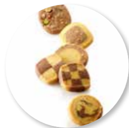
Assortiment Mocques 1500 g / ± 195 st. Ref. 0602