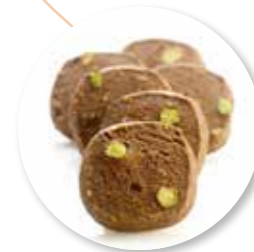
Cracao 950 g / ± 125 st. Ref. 06050