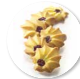
Sprits Framboos 750 g / ± 120 st. Ref. 0813