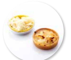
Bordalou Peer ± 110 g per st. / 8 Ø / 10 st. Ref. 05251 * -18°