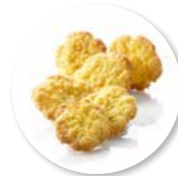
Kokos Krokant 650 g / ± 95 st. Ref. 0700