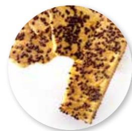
Brekkoeck Chocolate ± 990 g / 5 st. Ref. 1063