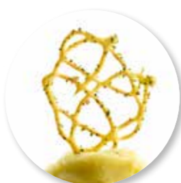
Rastoria Zeewier 50 st. Ref. 2208