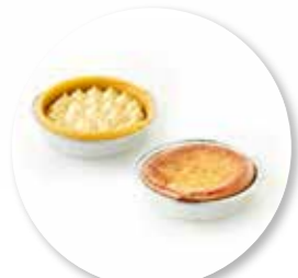
Bordalou Basis ± 60 g per st. / 8 Ø / 10 st. Ref. 05291 * -18°

Heeft u minder tijd, dan kunt u ook kiezen uit de Bordalou-gebakjes met rijst, peer, rood fruit of appel.