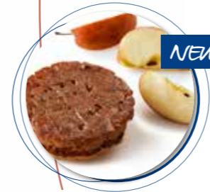
Tarte Tatin Appel & Limoen ± 120 g per st. / 10 Ø / 8 st. Ref. 18011 * -18°