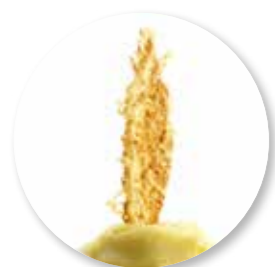
Parmesan Decor 50 st. Ref. 2201