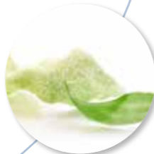
Kroepoek Wasabi 48 st. Ref. 1501

Serveertip Kroepoek Gerookte Paprika | Geitenkaas van Polle | Granité van Granny Smith | Citroengel | Aardappelkrokant