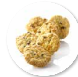
Crocros Chocolade 650 g / ± 95 st. Ref. 0721