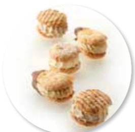
Biscuit Vanille 530 g Ref. 1076 * -18°