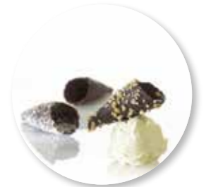
Assortiment Petit Cornet 45 st. Ref. 2402