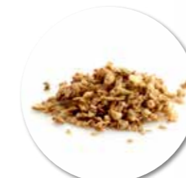
Granola # 7 Cashew Banaan 900 g - Ref. 0050