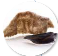
Kroepoek Sepia 48 st. Ref. 1505