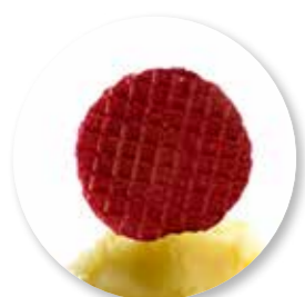
Gaufrette Rode Biet 180 st. Ref. 2211