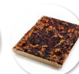
Amandel-Fruitcake Rood Fruit 385 x 280 x 32 mm / 2300 g Ref. 0404 * -18°