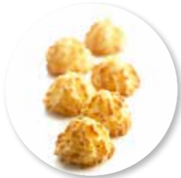
Rochers 1800 g / ± 135 st. Ref. 07101