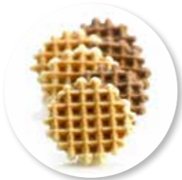
Assortiment Botergaletjes 1200 g / ± 185 st. Ref. 1011