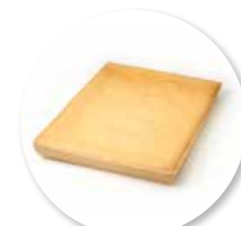
Biscuit Natuur 385 x 280 x 32 mm / 700 g Ref. 0001 * -18°