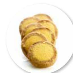
Sablé Mokka Hazelnoot 950 g / ± 125 st. Ref. 0631