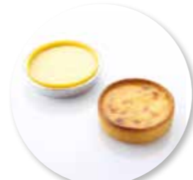
Rijsttaartje ± 80 g per st. / 8 Ø / 10 st. Ref. 0520 * -18°