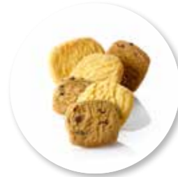
Assortiment Krokante Boterkoekjes 1100 g / ± 145 st. Ref. 1046