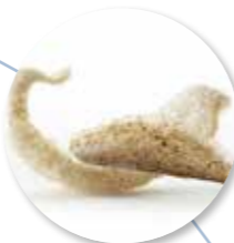
Kroepoek Truffel 48 st. Ref. 1506