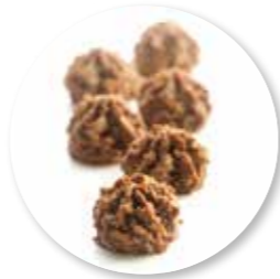
Rochers Chocolade 1800 g / ± 115 st. Ref. 07132