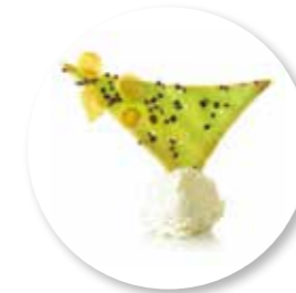
Trinité Pistache 50 st. Ref. 1619

Vanille-ijs | Vanille Noisette | Meringue Traditionnel | Frambozen | Aardbeien | Blauwe bessen