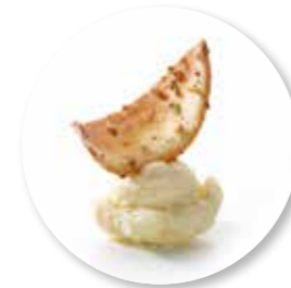
Vanille Noisette 40 st. Ref. 1610