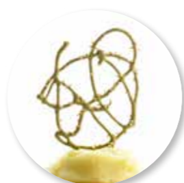
Rastoria Spinazie 50 st. Ref. 2203