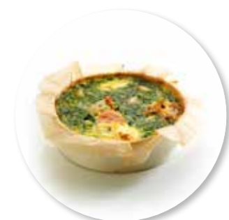
Quiche Méditerranée ± 140 g per st. / 10 Ø / 8 st. Ref. 0201 * -18°

Deze producten zijn verkrijgbaar in een zwarte box.