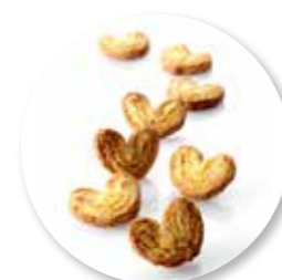
Palmiers 700 g / ± 142 st. Ref. 1008