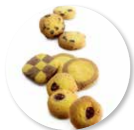
Assortiment Boterkoekjes Extra Fijn 600 g / ± 210 st. Ref. 1045