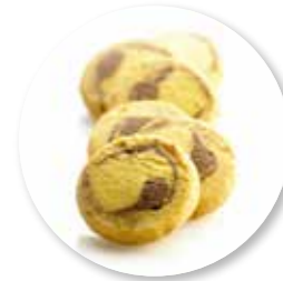
Marbré 950 g / ± 125 st. Ref. 06160