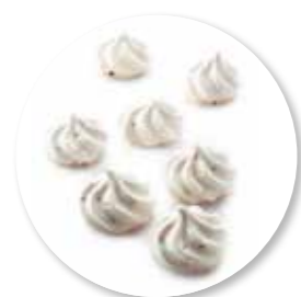
Meringue Choco Nips 250 g / Ref. 10240

Vanille-ijs | Slagroom | Meringue Mokka Hazelnoot | Klets koppen | Cacaopoeder | Gehakte Pistachenoten