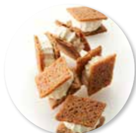
Tartine Russe 530 g Ref. 1077 * -18°