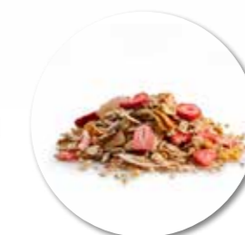
Granola # 8 Aardbei Mango 900g - Ref. 0053