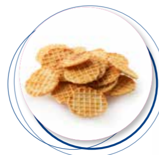
Mini Gaufrettes Maroilles Kaas 450 g / ± 360 st. Ref. 2252