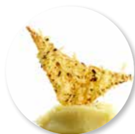
Mai Phai 50 st. Ref. 2200