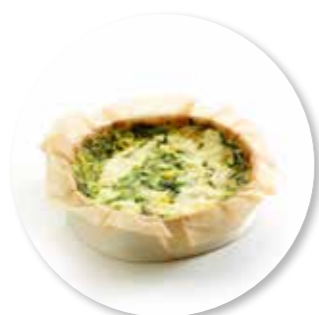
Quiche Ricotta Spinazie ± 140 g per st. / 10 Ø / 8 st. Ref. 0204 * -18°