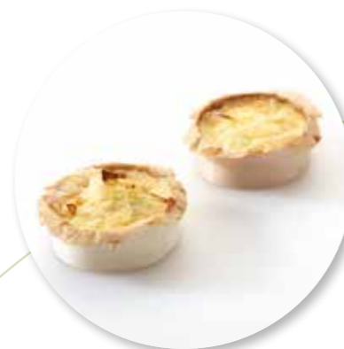
Mini Quiche Ham Prei Duvel ± 30 g per st. / 5 Ø / 15 st. Ref.1101 * -18°