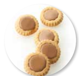
Délíce Melkchocolade 800 g / ± 100 st. Ref. 1071

De gastronomische koekjes zijn wat kleiner en fijner, wat zorgt voor een luxueuze presentatie. Serveer de gastronomische koekjes na het diner in combinatie met Belgische Pralines bij koffie of thee.