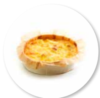
Quiche Ham Prei Duvel ± 140 g per st. / 10 Ø / 8 st. Ref. 0200 * -18°