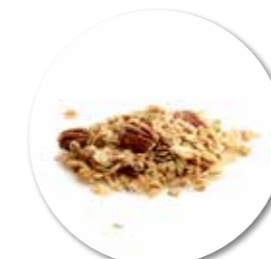
Granola # 5 Pecan Amandel 900 g - Ref. 0051