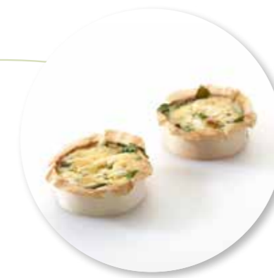
Mini Quiche Ricotta Spinazie ± 30 g per st. / 5 Ø / 15 st. Ref.1102 * -18°