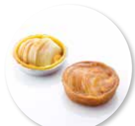
Bordalou Appel ± 110 g per st. / 8 Ø / 10 st. Ref. 05221 * -18°