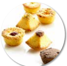
Assortiment Friands 750 g Ref. 1207 * -18°