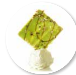
Carré Pistache 80 st. Ref. 1600