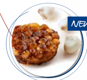
Tarte Tatin Zilveruitjes & Tijm ± 120 g per st. / 10 Ø / 8 st. Ref. 18031 * -18°