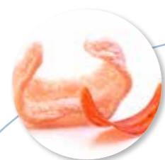
Kroepoek Rode Curry 48 st. Ref. 1503