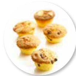
Assortiment Mini Cakes 1300 g / ± 150 st. Ref. 0221