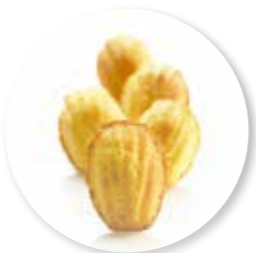
Mini Madeleines 1200 g / ± 120 st. Ref. 0252