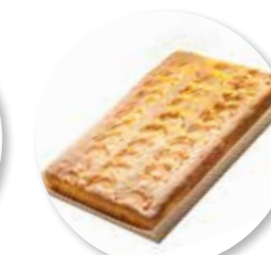
Appelcake 385 x 280 x 32 mm / 2500 g Ref. 0422 * 0-7°