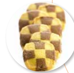
Domino 950 g / ± 135 st. Ref. 06120