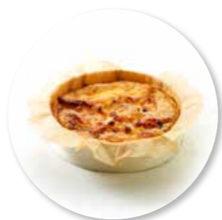
Quiche Geitenkaas Honing Hazelnoot ± 140 g per st. / 10 Ø / 8 st. Ref. 0215 * -18°