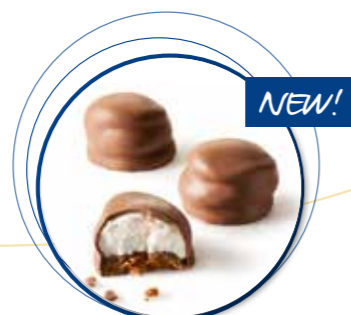
Mello Cakes Melkchocolade 22 g per st. / 20 st. Ref. 1086 * -18°