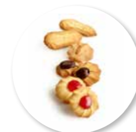
Retro Sprits 600 g / ± 80 st. Ref. 0820

Onze retrokoekjes zijn authentieke en smaakvolle koekjes uit de oude doos, die helemaal passen in de huidige trend van retro en vintage.