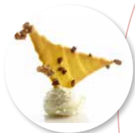
Trinité Citroen Chocoflakes 50 st. Ref. 16191