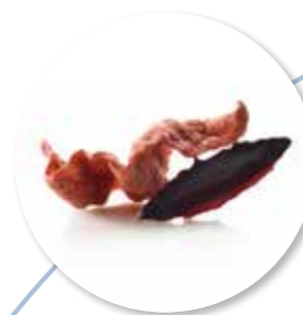
Kroepoek Chocolade 48 st. Ref. 1510