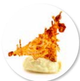
Waco Taco 50 st. Ref. 2213