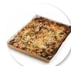
Amandel-Fruitcake Peer Chocolade 385 x 280 x 32 mm / 2300 g Ref. 0401 * -18°