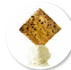
Carré Cappuccino 80 st. Ref. 16001