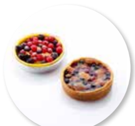
Bordalou Rood Fruit ± 100 g per st. / 8 Ø / 10 st. Ref. 05281 * -18°