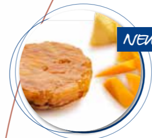
Tarte Tatin Exotisch ± 120 g per st. / 10 Ø / 8 st. Ref. 18021 * -18°