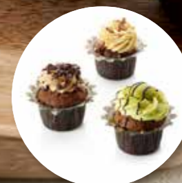
Cupcake Chocolate Collection ± 45 g per st. / 12 st. Ref. 03003 * -18°