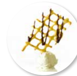
Soezenraster Vanille Chocolade 6 st. Ref. 1616