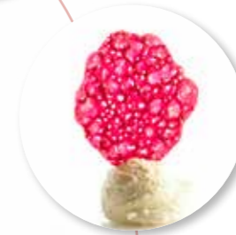
Kletsoppen Framboos 500 g / ± 125 st. Ref. 14071