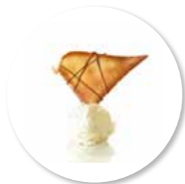
Tulipe Fantasie 40 st. Ref. 1608