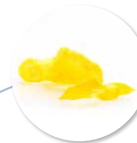
Kroepoek Saffraan 48 st. Ref. 1502