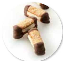
Bokkenpootjes 550 g Ref. 1075 * -18°

Deze producten zijn verkrijgbaar in een zwarte box.