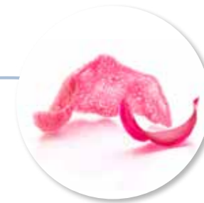
Kroepoek Rozenwater 48 st. Ref. 1500