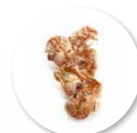
Retro Crocq' Amandel 250 g / ± 50 st. Ref. 1081