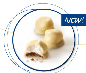
Mello Cakes Witte Chocolate 22 g per st. / 20 st. Ref. 1085 * -18°

De luxekoekjes en cakes van Didess worden zeer vakkundig en met passie gemaakt. Ze zijn een ware verwennerij op feestelijke momenten of als onderdeel van uw high tea.