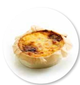
Quiche Bleu d'Auvergne Peer Amandel ± 140 g per st. / 10 Ø / 8 st. Ref. 0216 * -18°