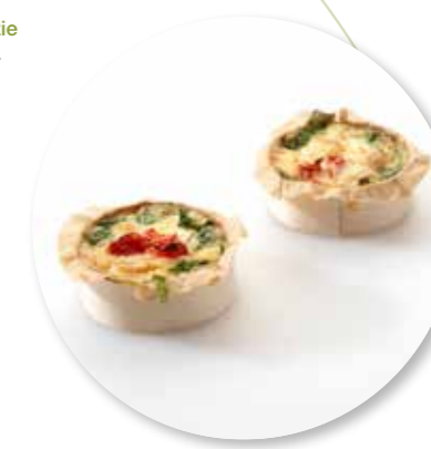
Mini Quiche Méditerranée ± 30 g per st. / 5 Ø / 15 st. Ref.1100 * -18°