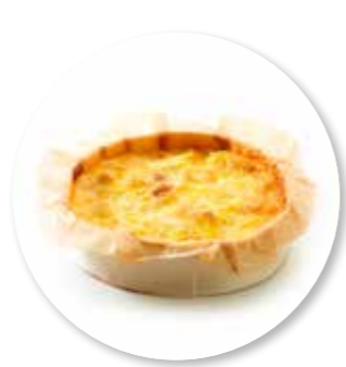
Quiche Lorraine ± 140 g per st. / 10 Ø / 8 st. Ref. 0219 * -18°