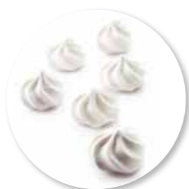
Meringue Traditionnel 250 g / Ref. 10242