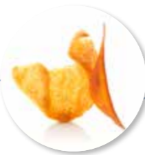
Kroepoek Gerookte Paprika 48 st. Ref. 1508