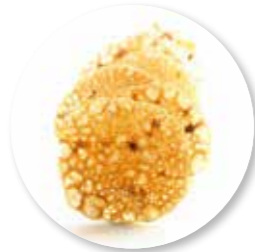
Klitskoppen Dessert 700 g / ± 180 st. Ref. 1403