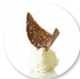
Chocolade Crispy 40 st. Ref. 1601