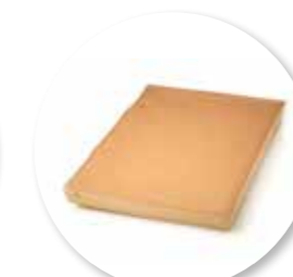
Biscuit Chocolade 385 x 280 x 32 mm / 700 g Ref. 0000 * -18°