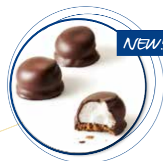
Mello Cakes Pure Chocolade 22 g per st. / 20 st. Ref. 1087 * -18°

Helemaal nieuw in het assortiment zijn de artisanale mello cakes naar creatie van Stephan Destrooper. Een krokant boterkoekje met praliné vulling, daarop Italiaanse meringue en afgewerkt met een perfect laagje chocolade. Welke smaak kies jij: fondant, melk of wit?