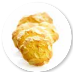
Amandines 950 g / ± 250 st. Ref. 0206