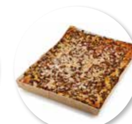
Amandel-Fruitcake Rabarber 385 x 280 x 32 mm / 2300 g Ref. 0403 * -18°