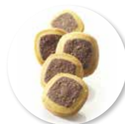
Sablé Chocolade 950 g / ± 105 st. Ref. 0632