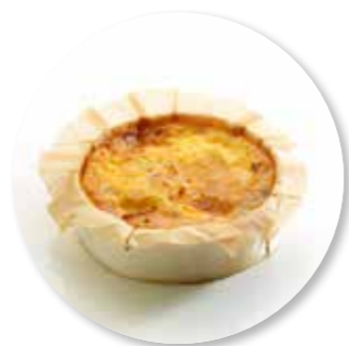
Quiche Brie Breydelspek ± 140 g per st. / 10 Ø / 8 st. Ref. 02131 * -18°