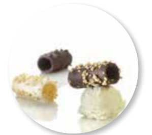
Assortiment Cannelloni 54 st. Ref. 2400