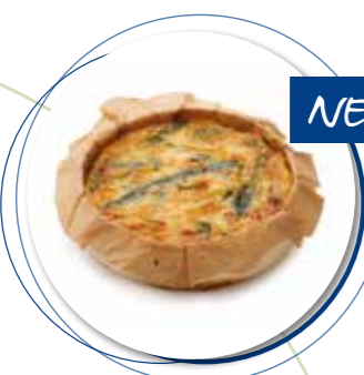
Quiche Tonijn ± 140 g per st. / 10 Ø / 8 st. Ref. 0221 * -18°