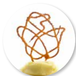
Rastoria Tomaat 50 st. Ref. 2204