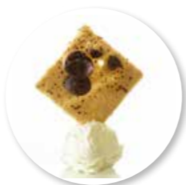
Carré Mokka Chocoflakes 50 st. Ref. 16002