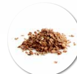
Granola # 3 Cacao 900 g - Ref. 0052