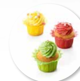
Cupcake Fruit Collection ± 45 g per st. / 12 st. Ref. 03000 * -18°